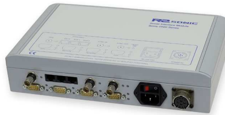
Module d'Interface Sonar