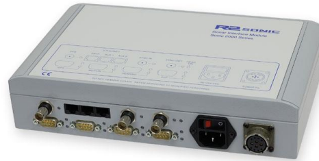
Module d'Interface Sonar